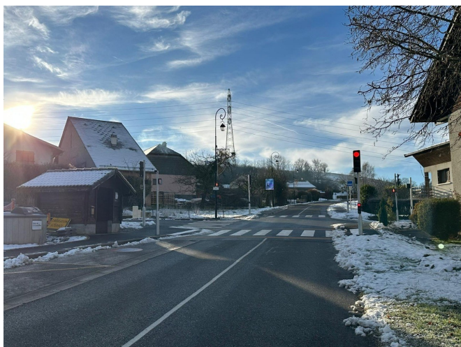
Carrefour Chez Viollet

Nous avons donc le plaisir de vous annoncer que la commune de Villy le Bouveret a obtenu le label cette année : le fruit d'efforts constants en matière de sécurité routière !