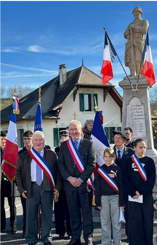
11 novembre : commémorations