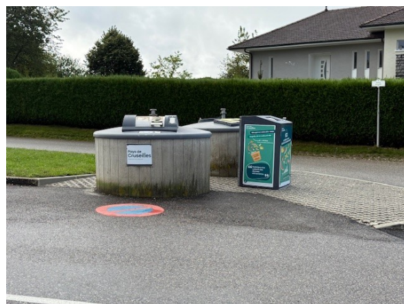
Point de collecte devant le rond-point de l'école

N'hésitez pas à prendre le réflexe d'y déposer vos déchets alimentaires !