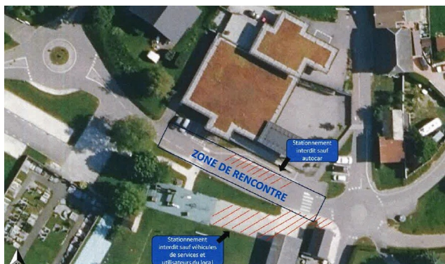
Zone de rencontre devant l'école

La commune de Villy le Bouveret œuvre en permanence pour la sécurité des usagers de la route. C'est pour acter cet engagement que nous avons candidaté cette année en vue d'obtenir le label « Ville Prudente ».