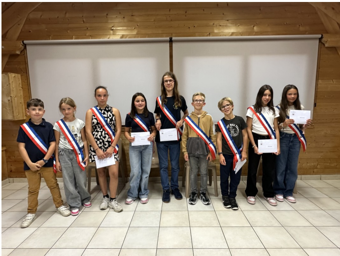
19 septembre : élection Conseil Municipal des Jeunes