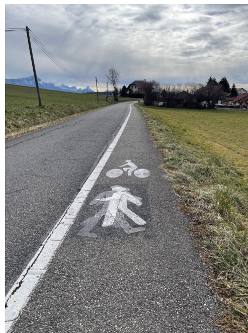
Liaison douce Chez Bestiat