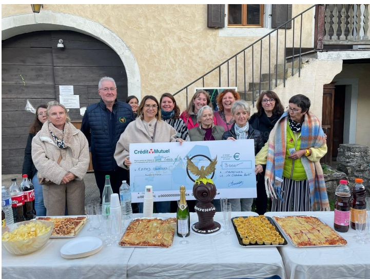
12 octobre : anniversaire de la recyclerie