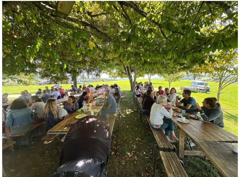
6 septembre : repas du village