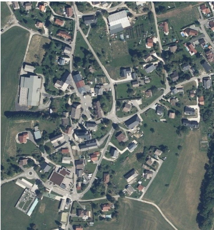
Vue aérienne du chef-lieu

Certaines parcelles sont situées dans des endroits « stratégiques » : des secteurs constructibles avec des enjeux importants. Cela est souvent le cas pour des terrains au chef-lieu.