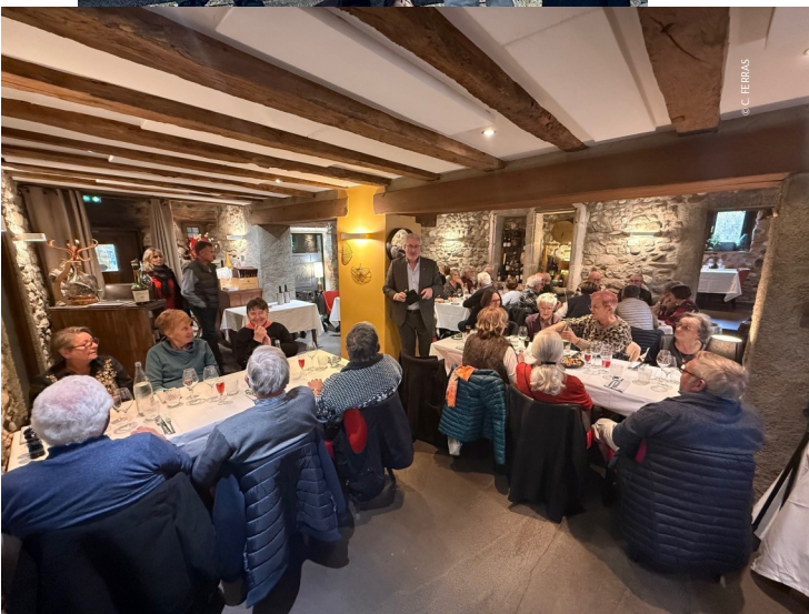
14 novembre : repas des retraités et des séniors