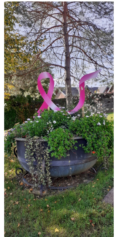
Octobre : décorations pour octobre Rose