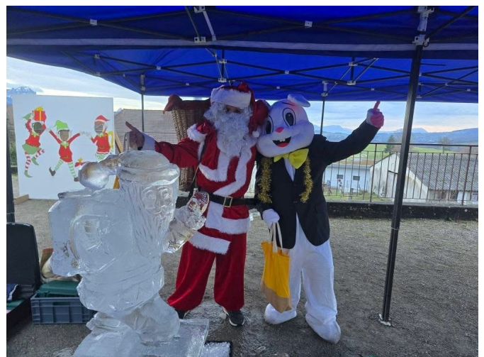
6 décembre : marché de Noël de l'APE