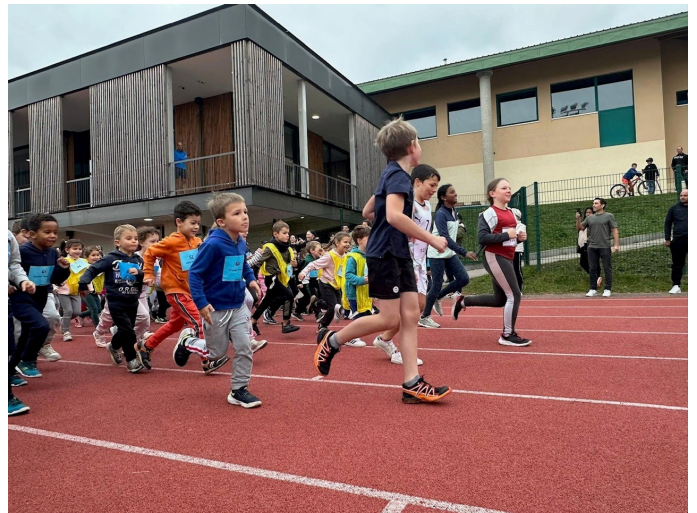
10 octobre : course longue de l'USEP à Cruseilles