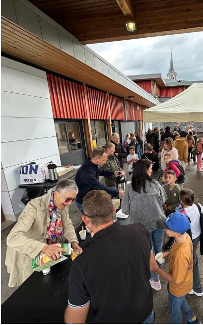
1er septembre : café de la rentrée