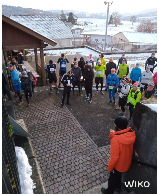
22 novembre : trail des Bornes à Villy le Bouveret