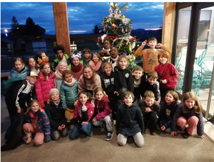
5 décembre : illumination du sapin de Graines de Favis